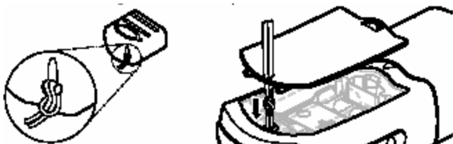
图 1 连接仪器帽栓线